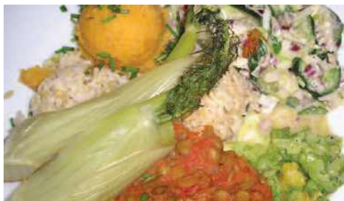
Feestelijk vegetarisch menu | nr. 440